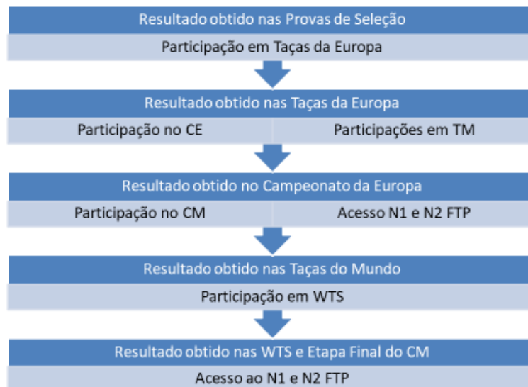
Figura 1 – Modelo de progressão Elite

A FTP assume um período de transição de 6 meses para que os atletas integrados no nível anterior se possam ajustar ao novo modelo que, em nosso entender, estimula uma progressão gradual de nível, dando acesso às competições de nível superior à medida que se atingem resultados de relevo nas competições de nível inferior. Este é também um modelo mais assertivo e desafiante para quem procura a excelência e luta por uma participação olímpica ou por resultados em Campeonatos da Europa ou do Mundo.